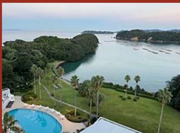
勤続報奨 宿のベランダから