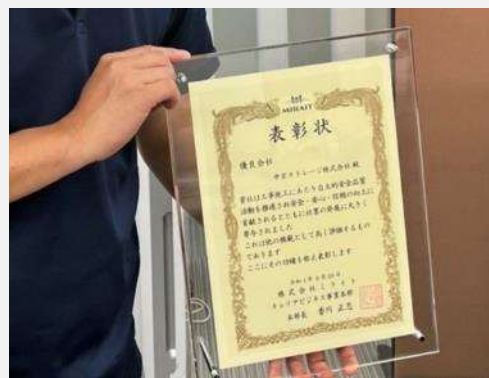
立派な賞状をいただきました！

優良施工会社として、株式会社ミライト様（現：株式会社ミライト・ワン様）より表彰の栄誉に与るとともに、全国安全大会にて弊社の取組みについて発表する、大変貴重な機会を頂きました。今後も安全品質活動を継続して行ってまいります。