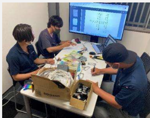
複線図、何秒で描けるかな